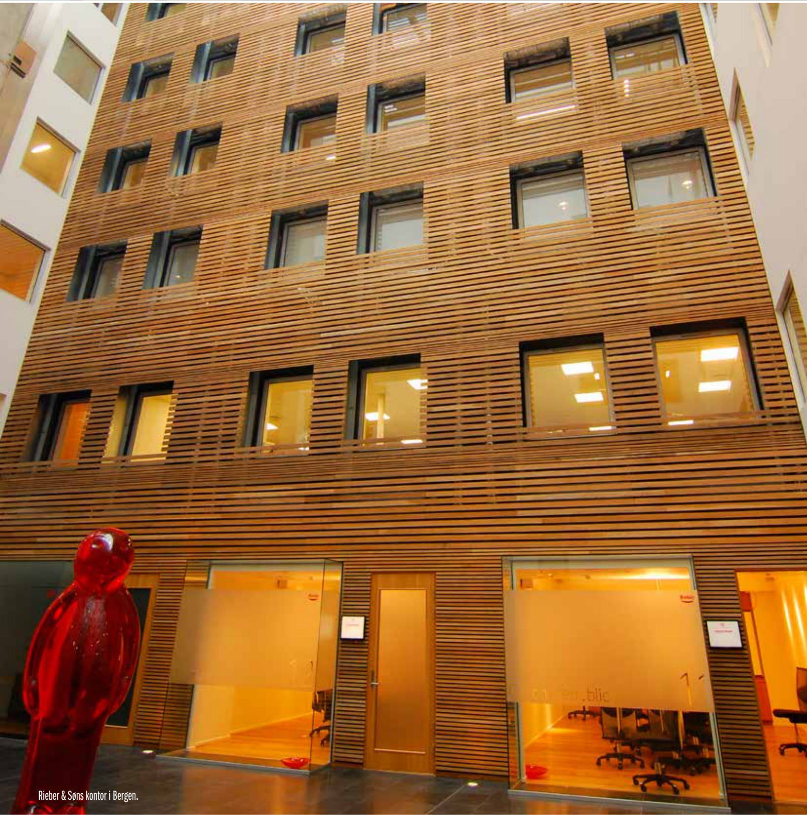
Rieber & Söns kontor i Bergen.