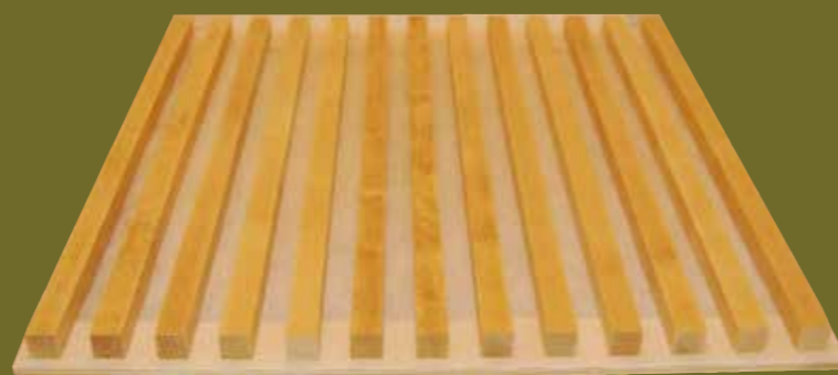
Kassett med björkribbor