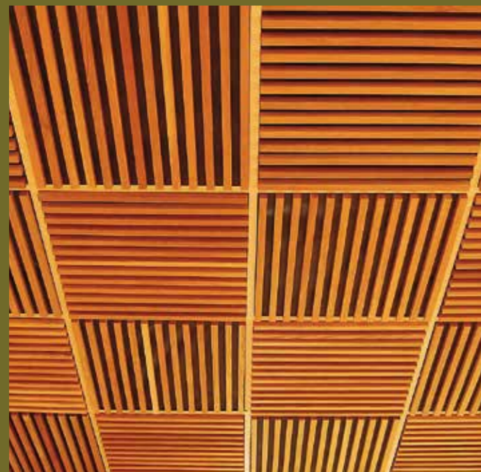
Tak med standardkassett med ekribbor

Akuwood-systemet är mycket snabbt och lätt att montera. Standardsystemet tillverkas i moduler 600x600 mm eller 600x1200 mm för att passa T-skenesystem.